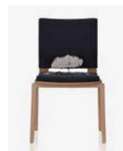
3.) Auswertung des Brennverhaltens