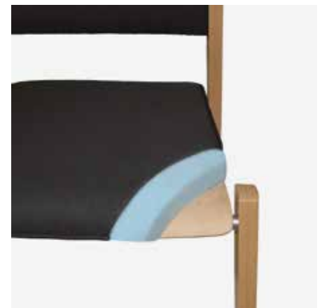
Polsterverbund STANDARD / STANDARD Plus

Die erste Abbildung zeigt den Aufbau des Polsterverbunds STANDARD , welcher in Kombination mit einem schwerentflammbaren Bezugsstoff die EN 1021 1+2 sowie die DIN 66084 P-b und P-c erfüllt. Darunter abgebildet ist der Polsterverbund ULTRA mit flammhemmendem Gewebe, welcher in Kombination mit einem schwerentflammbaren Bezugsstoff und einem CMHR-Schaum nach DIN 66084 P-a klassifiziert werden kann.