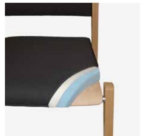
Polsterverbund ULTRA mit Interglas flamline