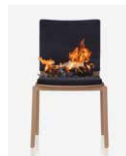
2.) Abbrand des Papierkissens