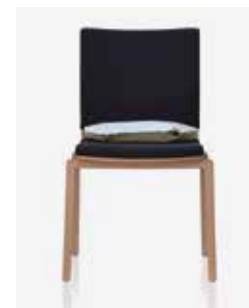
1.) Positionierung des Papierkissens

Nachfolgende Abbildungen zeigen in drei Schritten das Abbrennen eines Papierkissens nach DIN 54341.